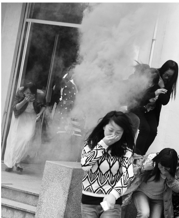
“5·12”防灾减灾日来临之际,学校于5月7日下午举行了一场防灾减灾应急演练。图为7、8号学生公寓女生们冒着滚滚“浓烟”,快速撤离宿舍。

又讯 5月10日,全国职业院校技能大赛选拔赛“移动互联网应用”浙江赛区竞赛在嘉兴举行,全省8所高职高专院校共16支队伍参加竞赛。电气信息学院代表队获二等奖、三等奖各1项,二等奖获得者届时将代表浙江省参加六月下旬在天津举办的全国技能大赛总决赛。(朱智达)