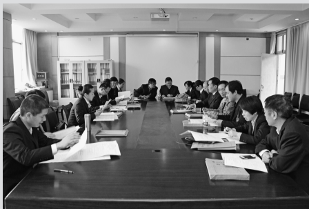
各代表团进行分组讨论 闭幕会上全体起立奏唱校歌