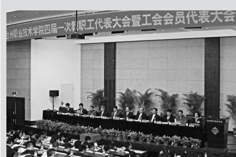
大会现场 代表们在进行无记名投票选举

校工会先后荣获省级“模范职工之家”和市级“先进职工之家”、“群体师德创优先进集体”等荣誉称号,2013年更是被评为“全国模范职工之家”。这些成绩的取得,是对我校工会工作的肯定,更激励着校工会向着更高的目标不断前行。