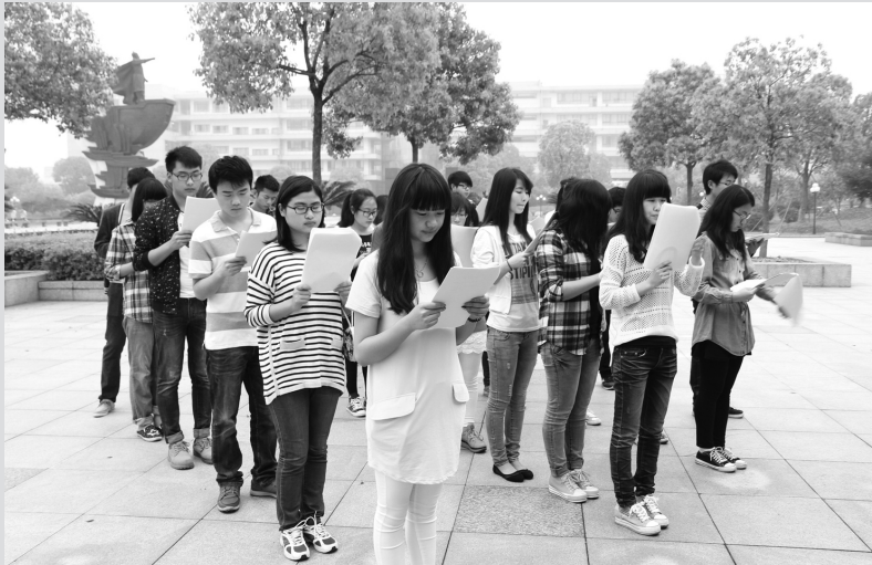
4月18日早上6时许,管理学院30多名青年学子和其他学院的学生一起,自发组织来到校园,整齐地排好队,进行早读。

章:没有打扰。欢迎同学们多来交流、反映情况,也祝同学们生活愉快,多学知识,早日成才!