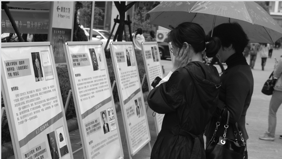
世界读书日当天,老师们正在观看“校长推荐好书”系列活动的宣传图文。