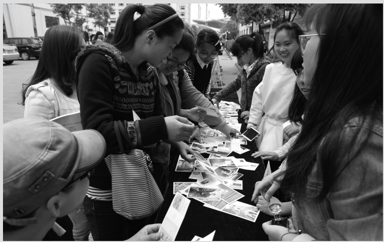
同学们正在挑选明信片,准备写下温馨话语,届时学生社团的同学们为其免费邮送。